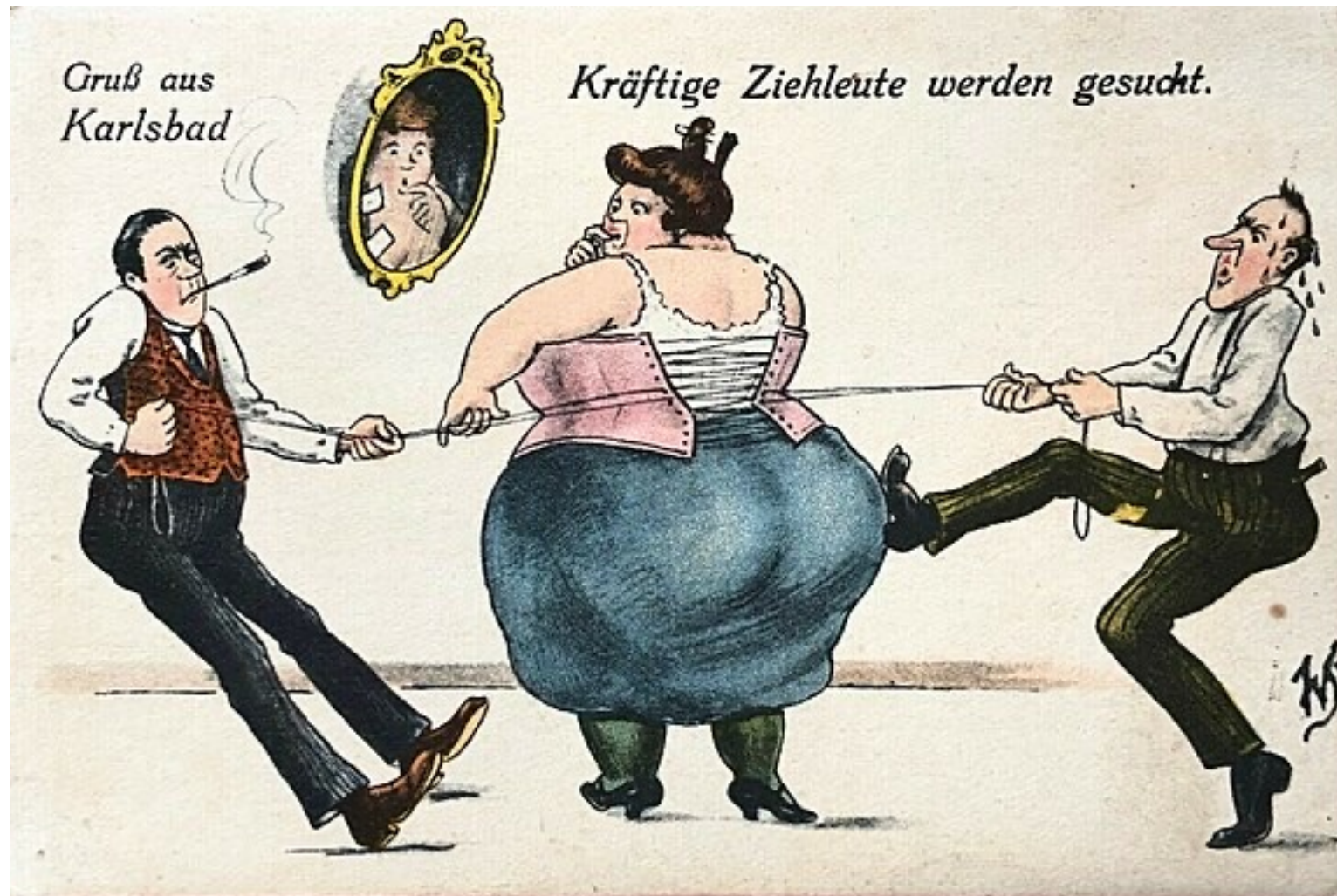
Hledají se silní chlapi.