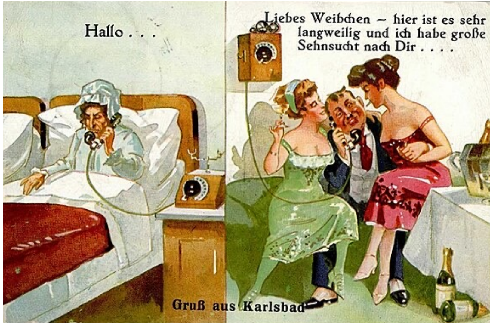
Miláčku, je zde velká nuda, moc po tobě toužím.