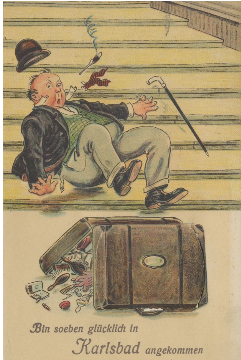
Právě jsem šťastně dorazil do Karlových Varů.