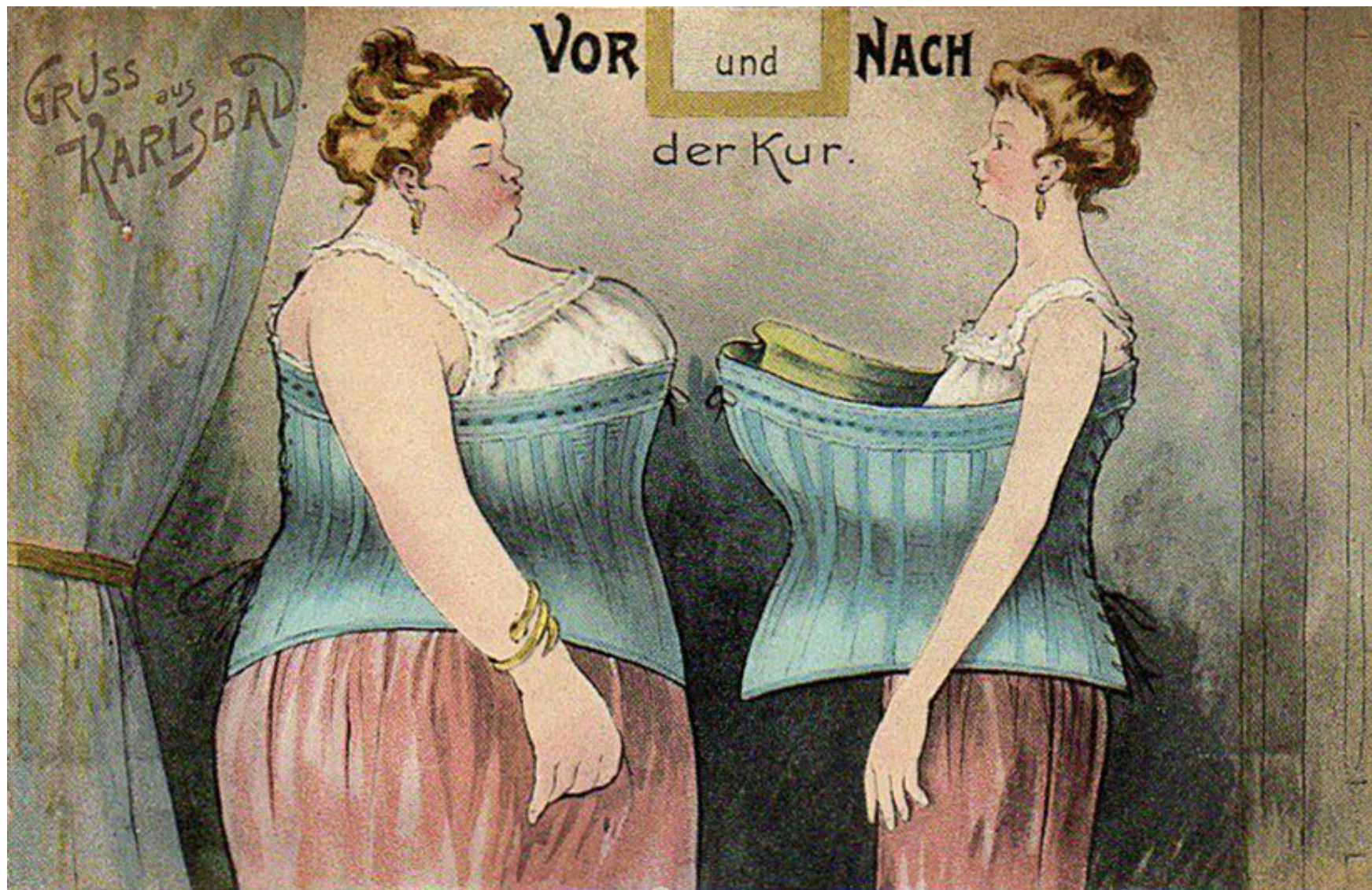
Před a po kúře.