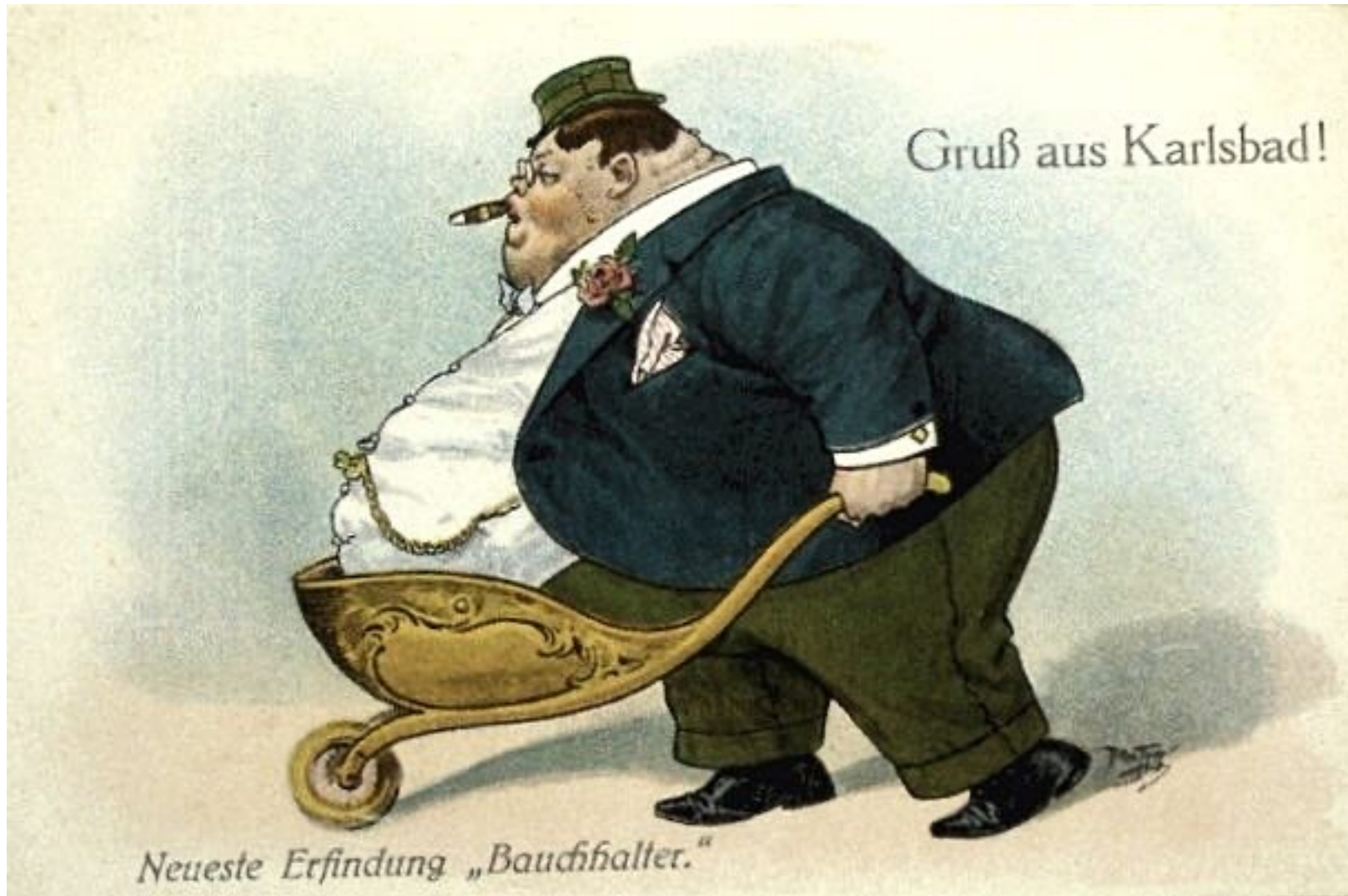
Nový vynález „Kolečko na vození břicha“