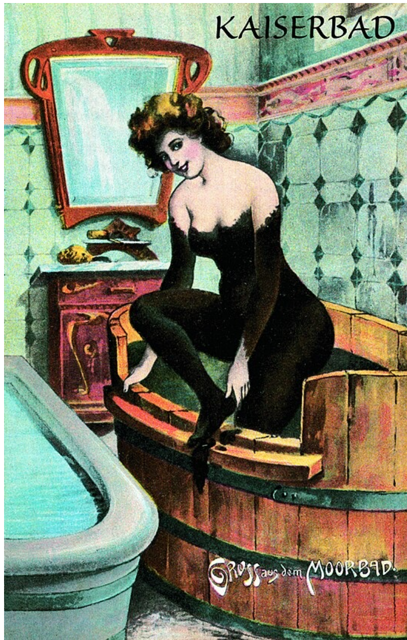
Pozdrav ze slatinné lázně