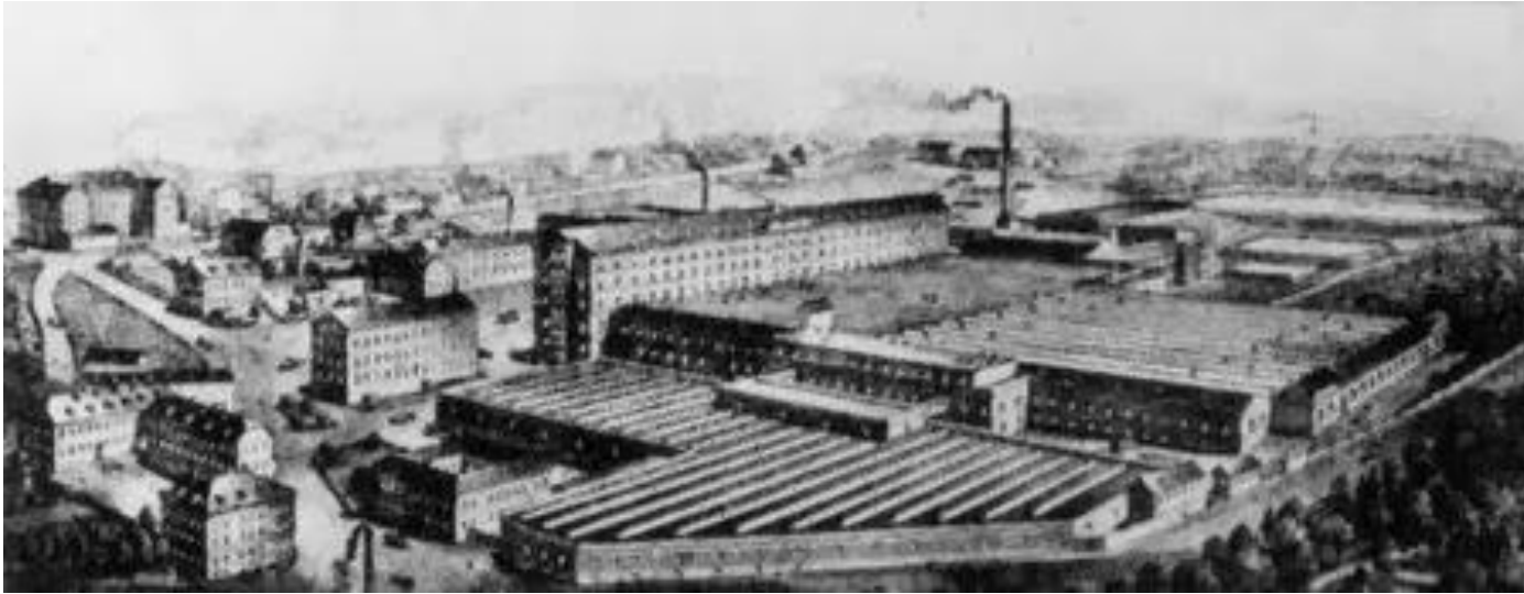
Christian Geipel & Sohn (Aš) České vlnářské závody Liberec, Textilana, závod Ohara Aš, Nura