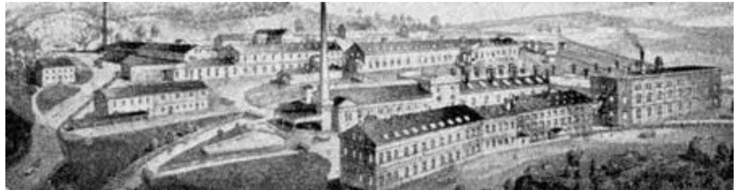
Christian Geipel & Sohn (Doubrava) České vlnářské závody Liberec, Textilana, závod Ohara Aš, Nura