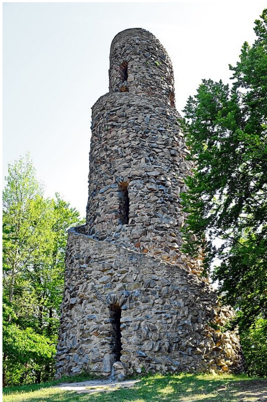
Rozhledna na Krásenském vrchu