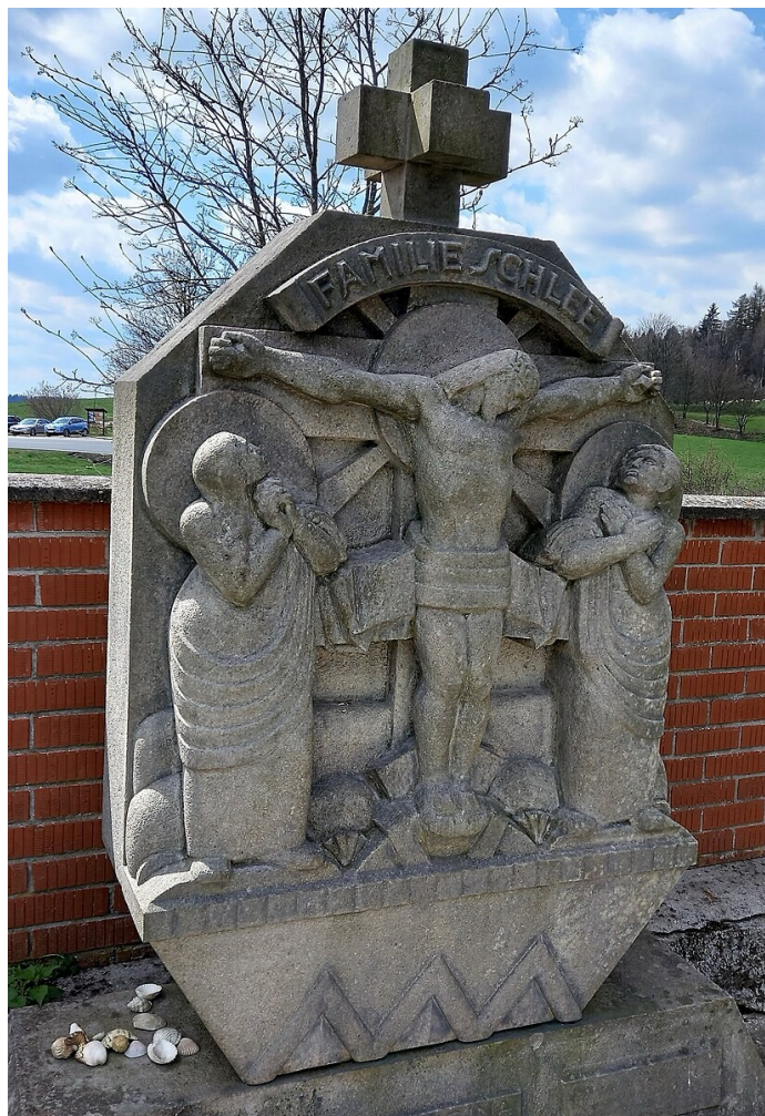
Náhrobek rodiny Schleeovy na hřbitově v Krásně