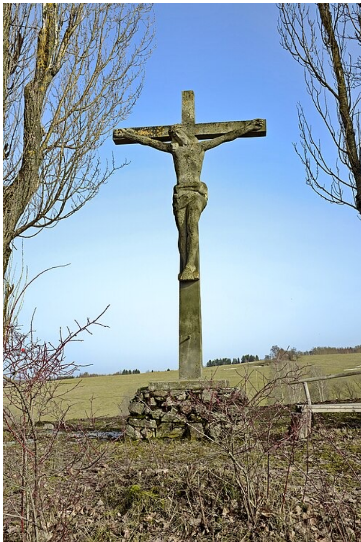
Krucifix na Kühbühlu v Krásně