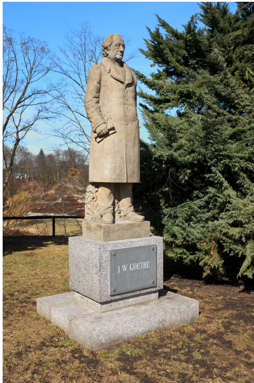
Socha J. W. Goetha v Lokti