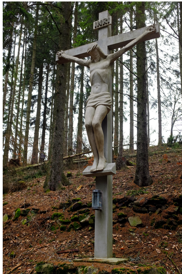
Krucifix na Kreuzbergu v Krásně