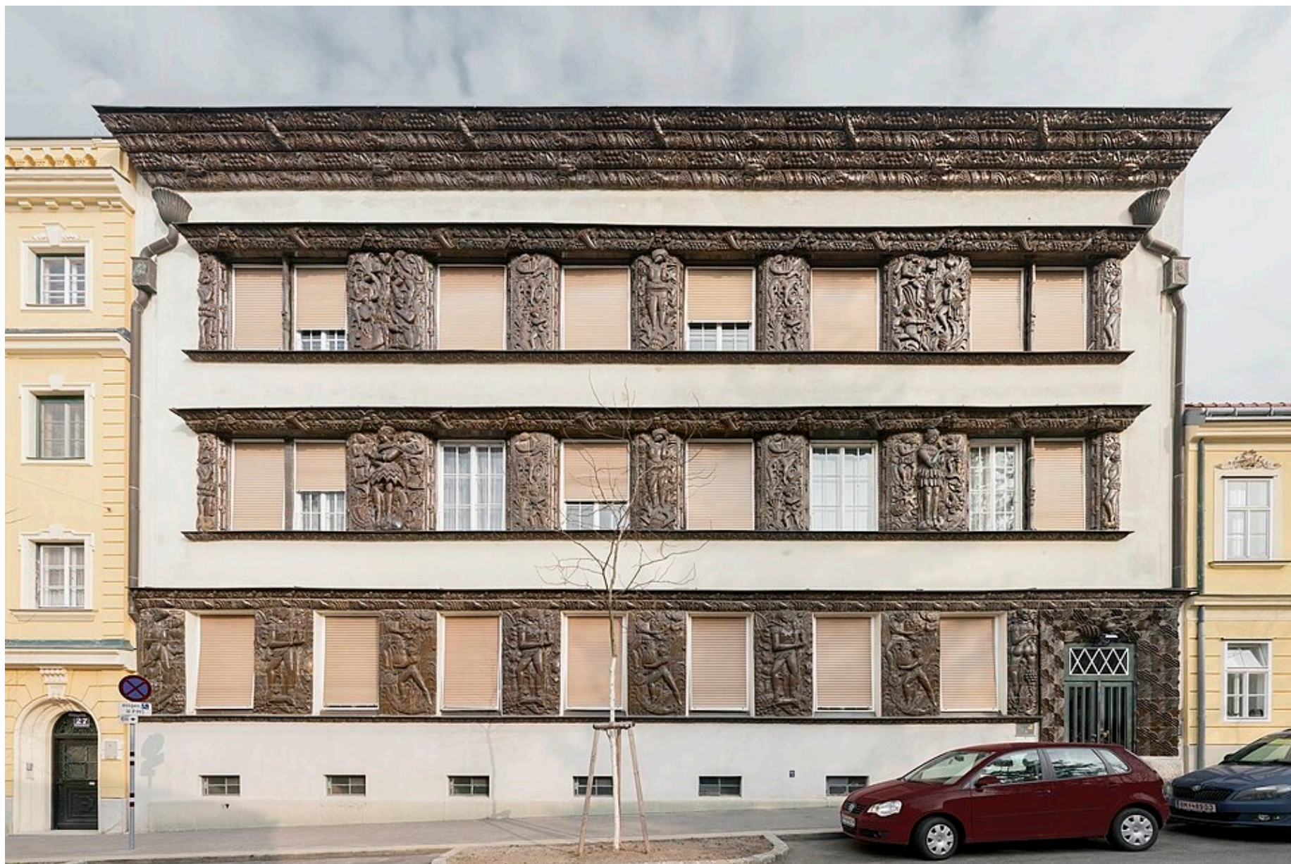
Čokoládový dům Vídeň-Hietzing