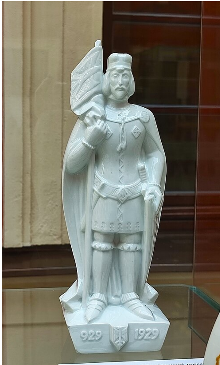
Svatý Václav (1929) porcelán Puls, Ostrov u Karlových Varů